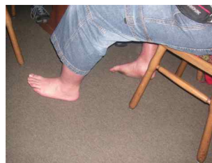
Ihm anscheinend auch