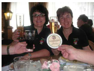
Na denn Prost