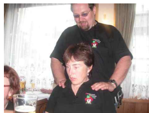
Ach was tut das gut